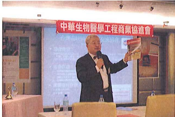
理事長說明海峽兩岸醫事交流協會合作案