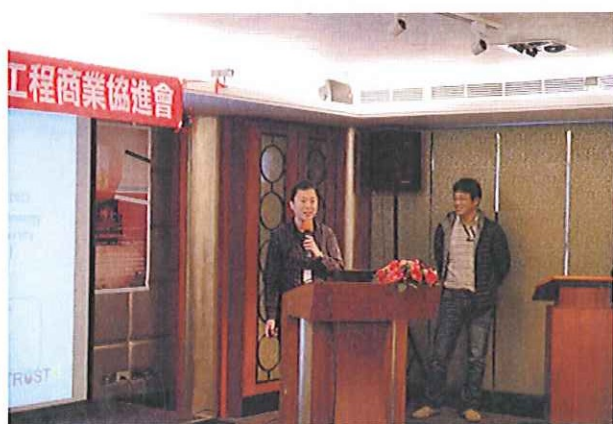
博信公司產品介紹