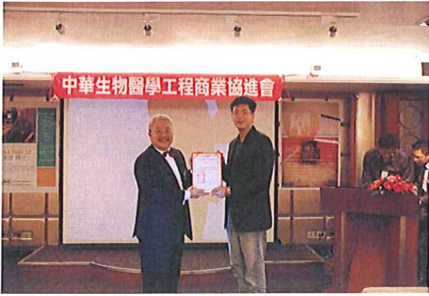
理事長致贈感謝狀