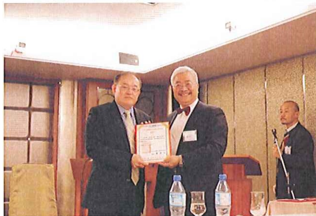
理事長致贈感謝狀