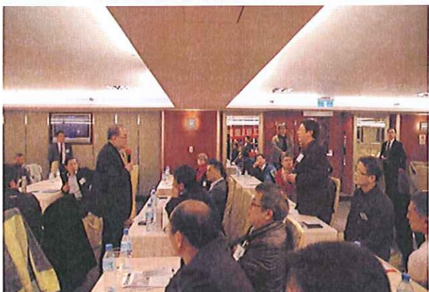
袁博士與會員互動熱絡