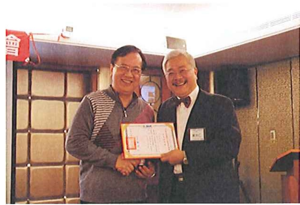
頒發監事當選證書