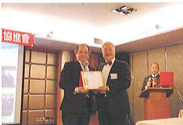
頒發理事當選證書